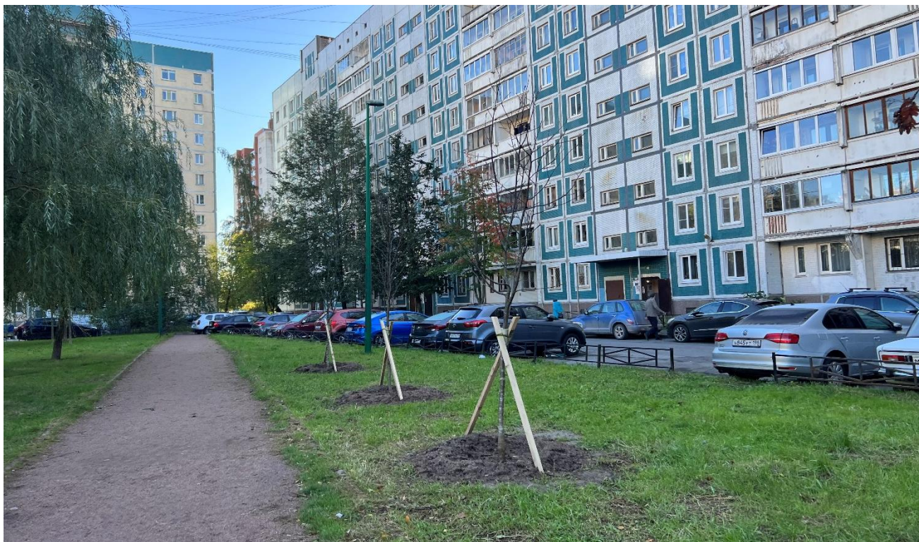
Ситцевая ул., д.15