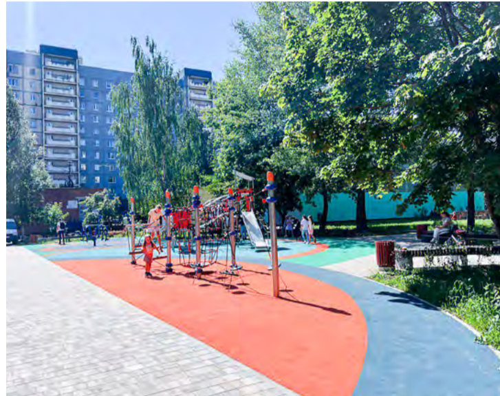
ул. Савушкина, 118

На площадке организованы три зоны: многофункциональная зона с игровым оборудованием для детей среднего и старшего возраста, зона с песочницей для малышей, а также зона отдыха с уличной мебелью. Выполнено озеленение территории, восстановлено газонное покрытие, установлены газонные ограждения, выполнено занижение бортовых камней.