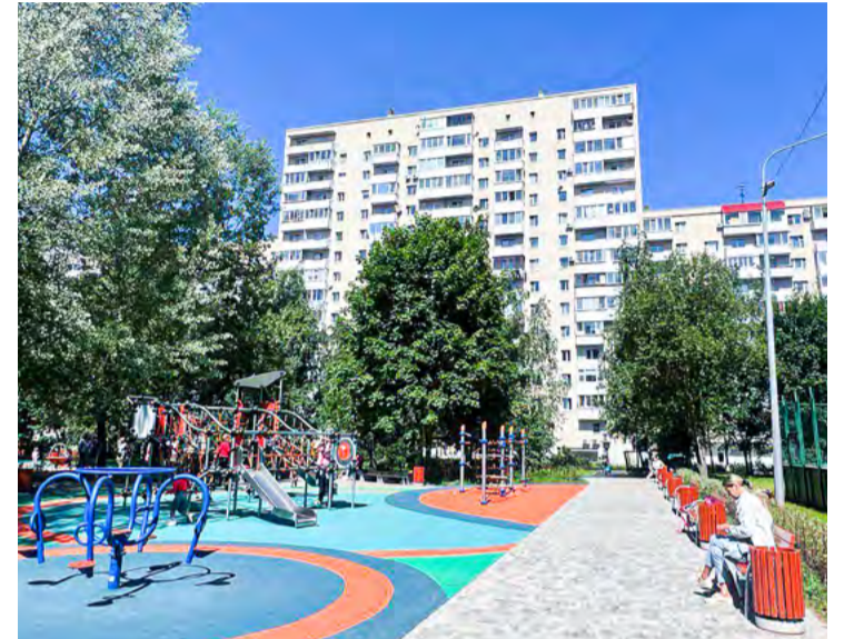
ул. Савушкина, 125, к.4