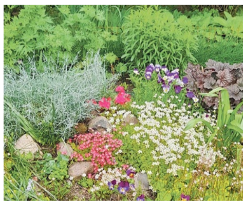
ул. Школьная, 110, к. 1