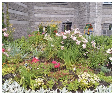
ул. Оптиков, 50, к. 2