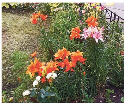
ул. Туристская, 30, к. 2

Подошел к концу конкурс на самый благоустроенный цветник в округе. В этом году участие приняли более 20 дворов и клумб МО № 65.