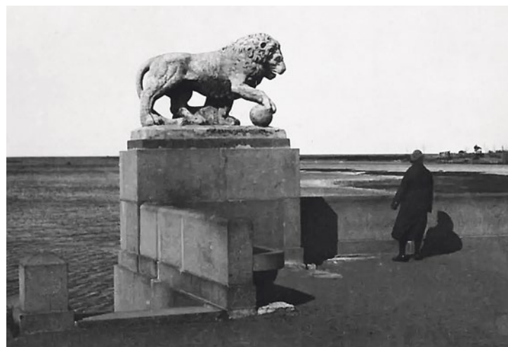
Ленинград, ЦПКИО, стрелка, 1930-е