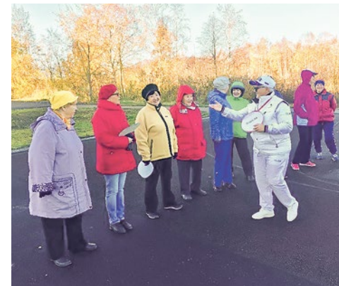
Фото из архива