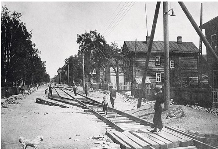
Старая Деревня, Мигуновская улица, 1929 г.