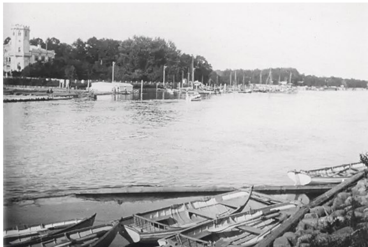
Яхт-клуб на Большой Невке, 1906 г.