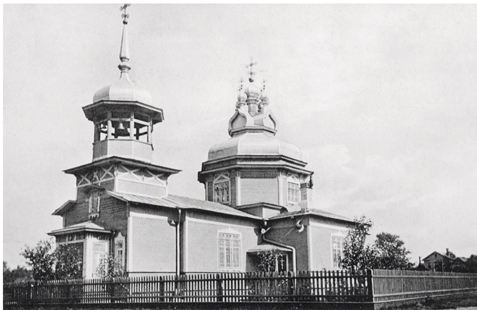
Церковь Димитрия Солунского в Коломягах, 1906–1917 гг.

В годы Великой Отечественной войны церковь Димитрия Солунского, в которой не прекращалось служение, имела особое значение в жизни коломяжцев – все девятьсот дней блокады была поддержкой, опорой, а порой и пристанищем. С апреля 1940 года все военные и нелегкие послевоенные годы настоятелем храма был прото-