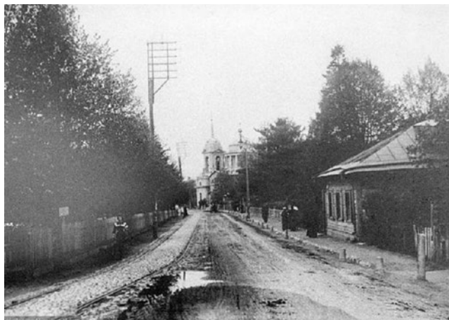
Благовещенская улица, 1913 год