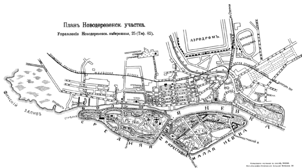
Карта района Старой Деревни и Новодеревенского участка

Ближе к границе с Новой Деревней – Благовещенская церковь, она действовала и до войны. По праздникам перед храмом порядок охраняла конная милиция. На Пасху столы для куличей выносили прямо на улицу, к современному Приморскому проспекту. В 1938 году в церкви обнаружили склад оружия, помню, как от храма отъезжали грузовики, доверху нагруженные чем-то тяжелым. Мы еще тогда думали: «Зачем в церкви оружие?» (Благовещенскую церковь официально закрыли в октябре 1937 года, ценную утварь реквизируют, остальное имущество разворовали. Вероятно, отсюда и история со «складом оружия». (прим. авт.). Возле церкви было небольшое кладбище, на нем простых людей не хоронили, только князей, графов... Когда разбивали сквер, захоронения вывезли. (На самом деле, тогда кладбище было фактически уничтожено: разорены и разграблены семейные усыпальницы Никитиных и Орловых-Денисовых, останки выброшены на свалку, другие погребения вывезены и утрачены. (прим. авт.). Там, где сейчас Серебряков переулок, был большущий овраг, через него перекинут мостик. На берегу оврага, на холме, было кладбище, которое тянулось на запад до самой школы, выстроенной уже после войны (общественное Стародеревенское кладбище, существовавшее между современными улицами Дибуновской и Школьной, исчезло, его территория застроена в 1960-х годах. (прим. авт.)