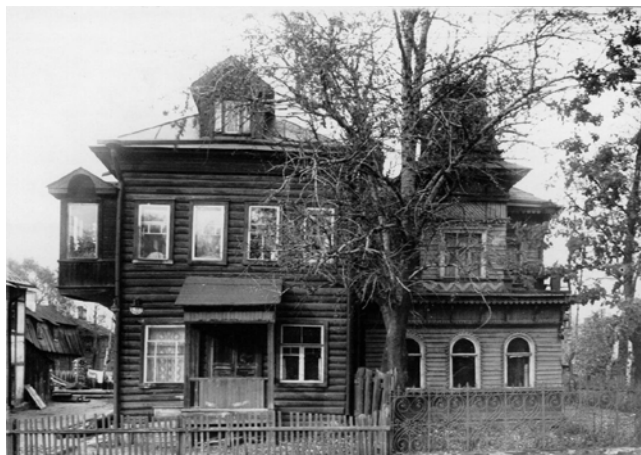
Деревянная постройка в Старой Деревне, 1939 год