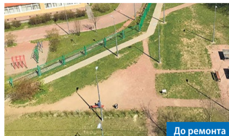
Богатырский пр., 59, к. 1