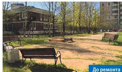
Камышовая ул., 30