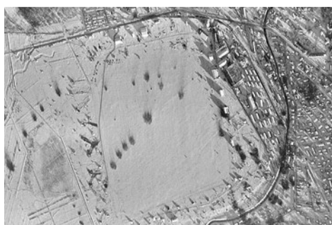
Комендантский аэродром после бомбежки, зима 1941–1942 гг.