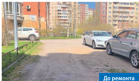
Богатырский пр., 59, к. 3