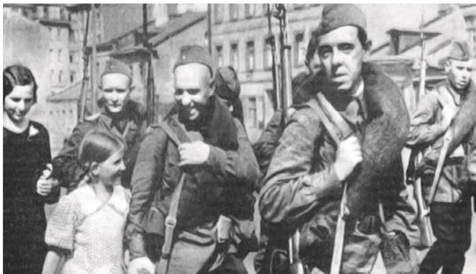
Проводы ополченцев, лето 1941 г.

Приморский район в годы войны сыграл немалую роль в деле освобождения города от врага. В 1942 году в бывшем буддийском храме на Старой Деревне заработала секретная радиостанция для связи с «Большой землей». А промышленные предприятия, находившиеся на территории нынешнего МО № 65, наладили выпуск сторожевых катеров и ящиков для снарядов. Подробнее – в материале краеведа Андрея Жданова.