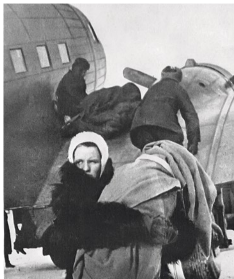
Эвакуация с Комендантского аэродрома

В 1942 году в бывшем буддийском храме начала работать мощная длинноволновая радиостанция для связи осажденного города с «Большой землей». Радиостанция являлась совершенно секретной и именовалась в документах как объект № 46. Для транслирования передач ленинградские ученые разработали уникальную аэростатную антенну без мачт. В качестве антенны использовался металлический трос, один конец которого цепляли за грузовик во дворе храма, а второй поднимали в воздух на аэростате. Летательный аппарат находился в боевых порядках с другими аэростатами, и его не мог обнаружить противник. Благодаря этой радиостанции передачи шли не только на Москву, но и на всю страну, и даже за рубеж. Таким способом транслировалось первое исполнение 7-й Ленинградской симфонии Д. Д. Шостаковича.