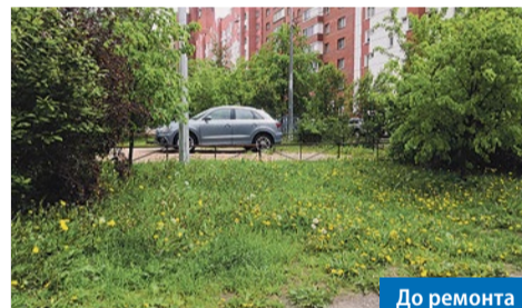
Богатырский пр., 59, к. 3