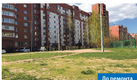
Богатырский пр., 59, к. 1