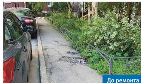
ул. Савушкина, 130, к.2