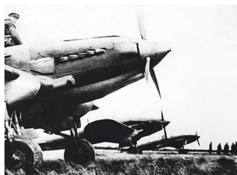
Комендантский аэродром, ИЛ-2