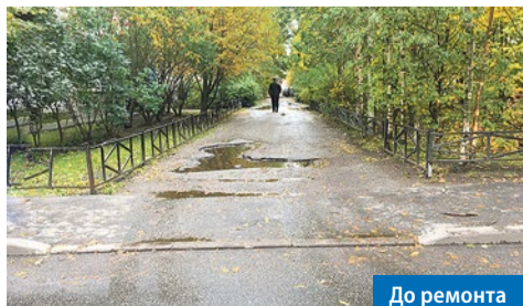
Планерная ул., 23, к. 1