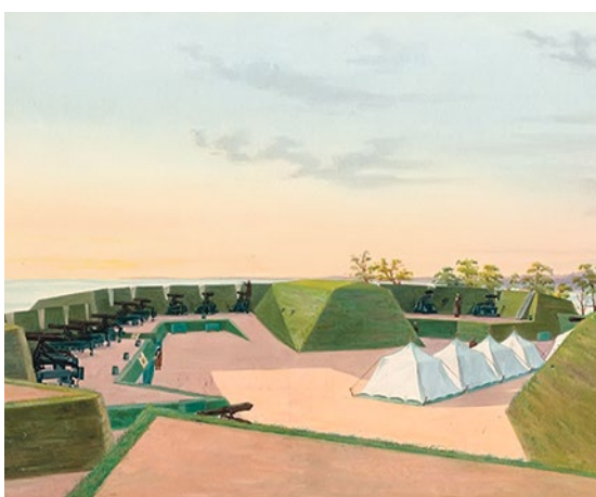
Редут на мысе Лисий Нос, 1855 г.