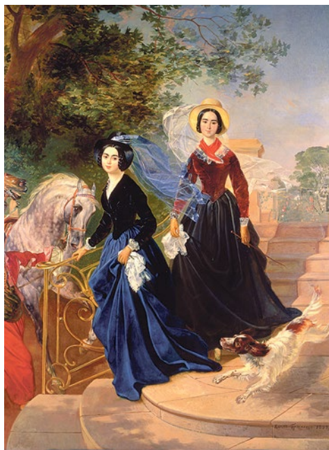
Портрет сестер Шишмаревых, К. П. Брюллов, 1839 г.

В прошлом номере «Муниципальный вестник» рассказывал о дачной местности, которая двести лет назад занимала весь правый берег Большой Невки. В этом выпуске мы подробнее остановимся на истории дачи Алсуфьевых и увеселительного сада «Альгамбра», расположенных на территории нашего округа.