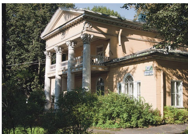
Дача А. Ф. Шишмарева