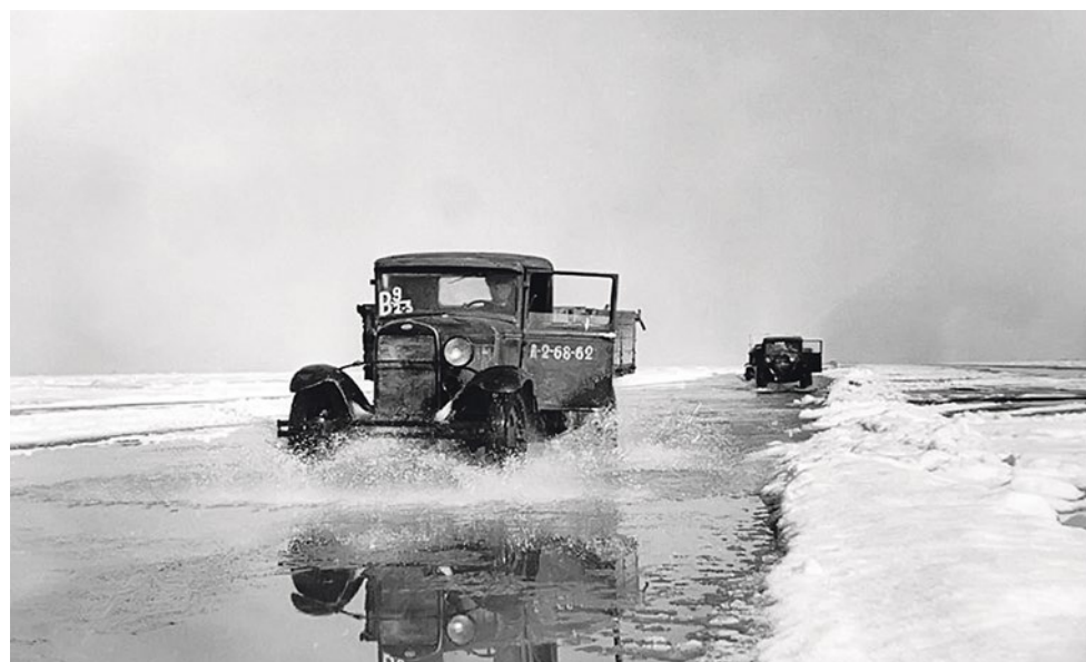
«Дорога жизни» весной, 1942 г.