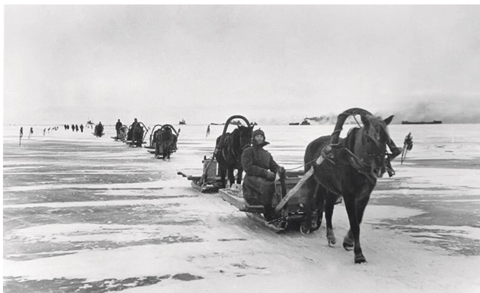
Обоз за продуктами для блокадного Ленинграда на льду Ладожского озера, 1941 г.