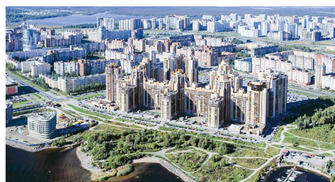
СТРОИМ БУДУЩЕЕ ВМЕСТЕ