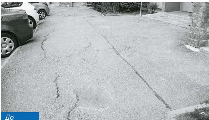
Мебельная улица, 45, к. 1, к. 2