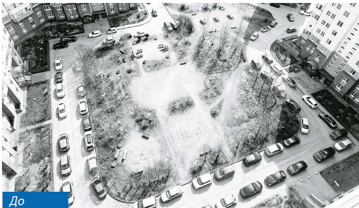
улица Оптиков, 52, к. 2

По результатам городских конкурсов в 2023 г. объект по адресу ул. Оптиков, 52, к. 2, занял лидирующие позиции в следующих номинациях: «Лучший благоустроенный двор новой застройки» – 1-е место, «Самая благоустроенная дворовая территория» – 1-е место.